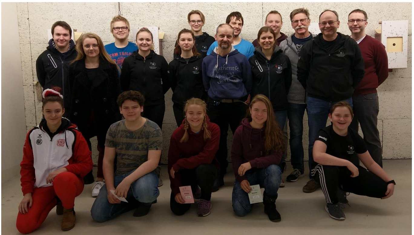
Fast alle Teilnehmer 2019